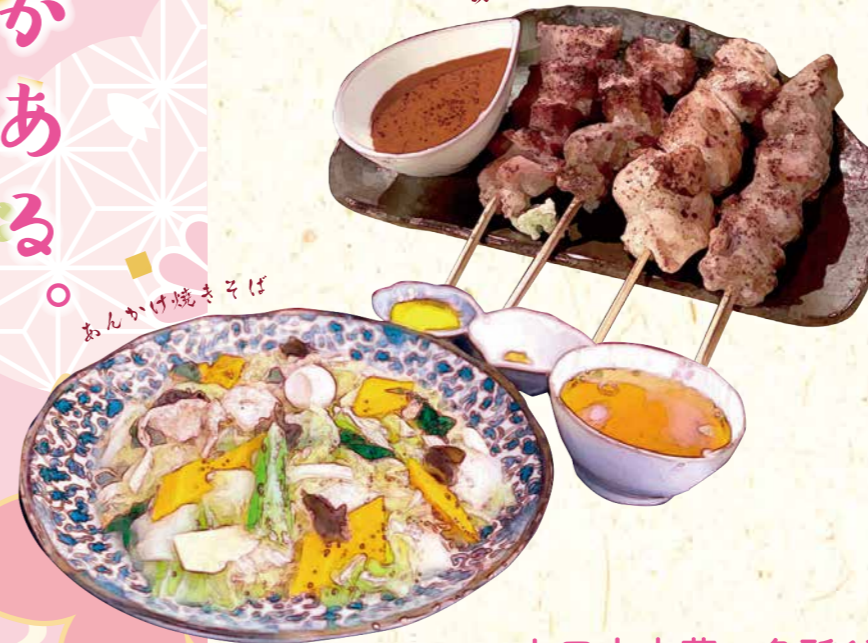
あんかけ焼きそば