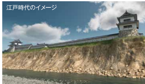
江戸時代のイメージ

かつて、城の南には千曲川が流れ、緩やかで深みのある流れが天然の堀となっていました。この場所を「尼ヶ淵」と称したことから、上田城は「尼ヶ淵城」と呼ばれていたという説もあります。