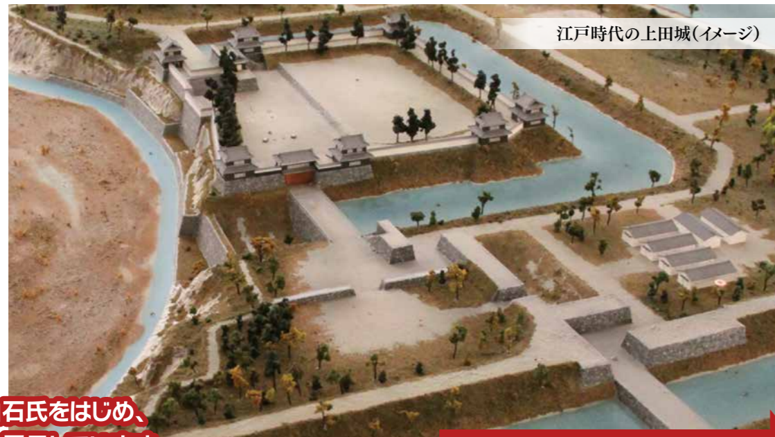
江戸時代の上田城(イメージ)

A.7つの櫓や2つの櫓門がある堅い守りの城でした。今でも、堀や石垣など江戸時代の面影が感じられます。